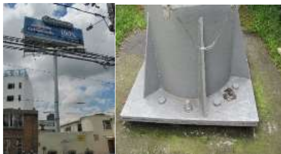
VISTA PANORÁMICA DEL ELEMENTO Y PLACA BASE – ARRANQUE MÁSTIL